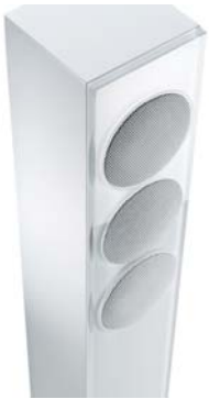
Column 02 weiß