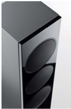
Column 02 schwarz