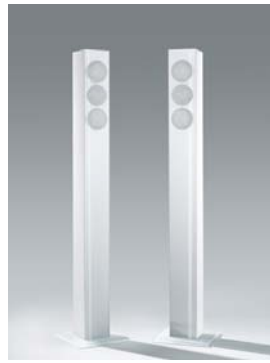
Column 02 weiß Paar