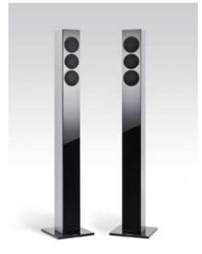
Column 02 schwarz Paar