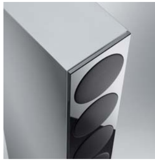
Prestige mit schwarzer Glasfront