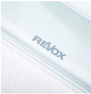
Logo auf weißem Glassfuß

Die elegante Klangsäule liefert als Stereolautsprecher ebenso wie in Surround-Konfigurationen, zusammen mit dem Re:sound G center und den Re:sound G column, exzellente Klangergebnisse.