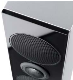
Glass Front Detail

Fast unsichtbar: Mit der Wandhalterung können Sie den Re:sound G shelf optimal positionieren.